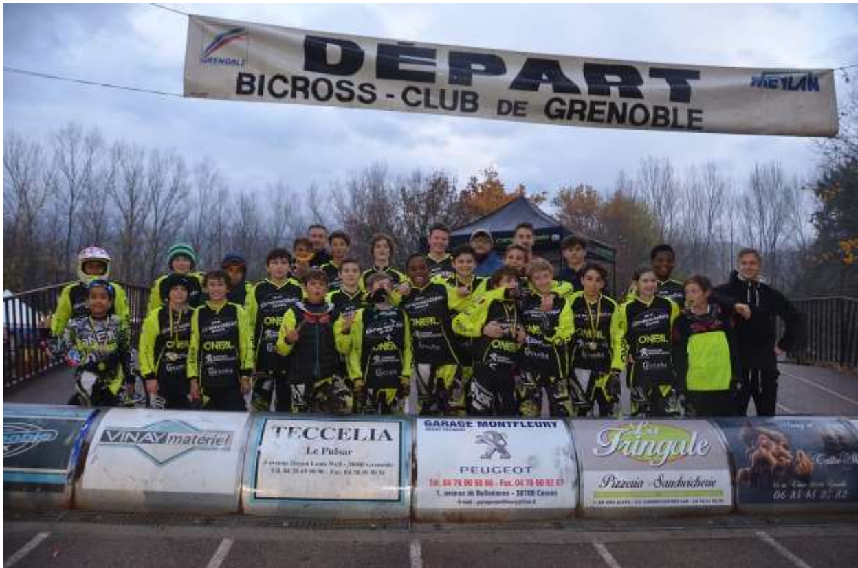
Coupe des Lacs édition 2017